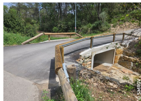
Les travaux se sont terminés en avril 2025. Coût de l'opération : 65 000 € HT

Ce nouveau franchissement qui relie la commune du Castellet au Beausset, permet d'absorber une crue d'occurrence trentennale, contre un débit biennal avant travaux.